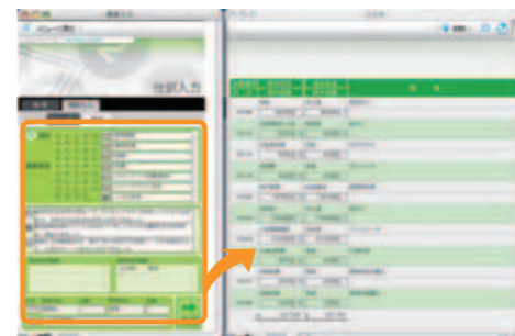
▲仕訳入力画面 摘要項目の読みをキーにして選択していくと適切な仕訳が入力されます。

摘要項目を選択、表示される解説文から取引内容に合ったものを選択していくことで、仕訳を入力します。バインダー同様多数のケースが収録されています。逆引きのお手軽仕訳です。