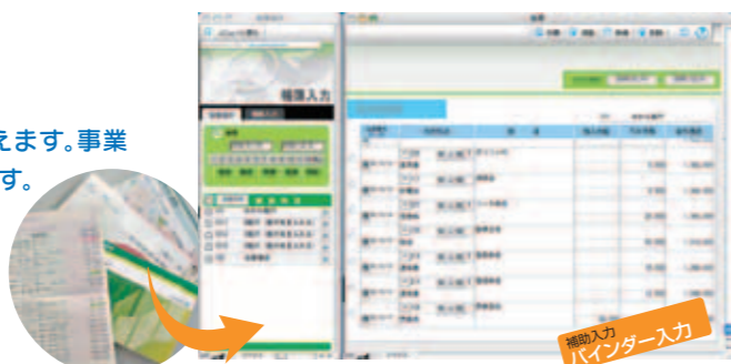
帳簿入力画面「預金出納帳」

〔01〕の科目登録の初期残高に前年末の通帳残高を入力しておけば、繰越残高の初期値として表示します。