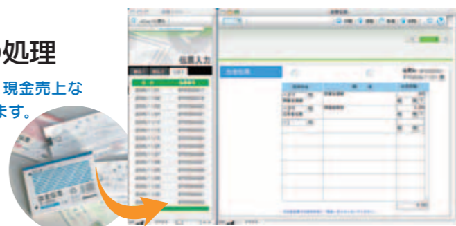
伝票入力画面「出金伝票」

ここまでに入力した、預金出納、売掛、買掛データの内、相手科目が「現金」のもののみが表示されます。