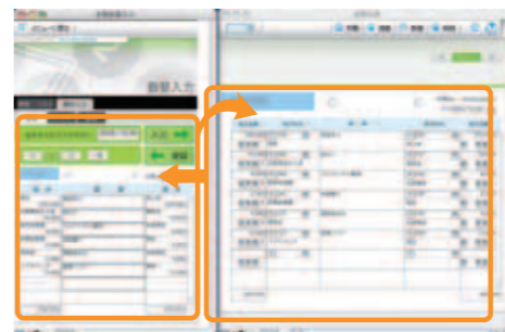
▲伝票入力画面 「定型」として登録した伝票を活用します。定型の登録は、いつでも行えます。

作成した振替伝票を定型伝票として登録。ワンクリックで振替伝票を作成できるようになります。毎月の定型仕訳で、同じ作業をくり返す必要がなくなりますから、作業効率は大幅にアップします。