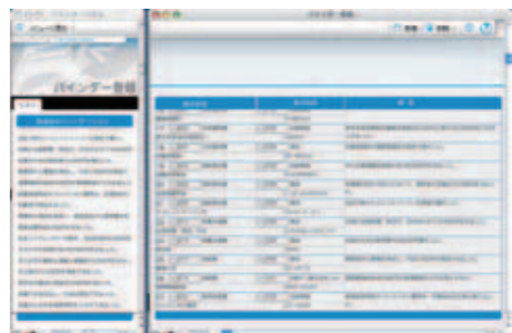
▲バインダー登録画面 一括登録や保守を行います。登録した内容は仕訳帳や伝票の入力時に選択入力できます。

よくある取引の摘要(取引内容のメモ)を多数収録! 選択するだけで仕訳が入力されます。自分で作成した仕訳をバインダーに登録することもできます。使えば使うほど便利になる機能です。