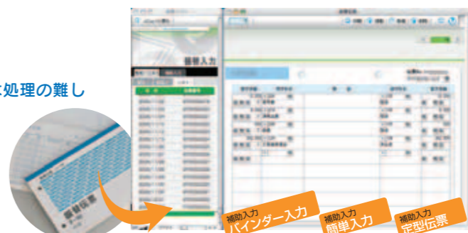
振替入力画面「仕訳伝票」

振替処理の仕訳方法に迷ったら、上に紹介した補助入力機能「バインダー入力」や「簡単入力(仕訳辞書)」を利用します。一覧から選択していくだけで入力完了。バインダーには覚えてたの仕訳も登録できます。