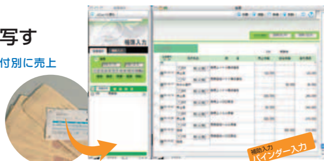
帳簿入力画面「売掛帳」

売掛帳では、用意した伝票の相手科目→[売上高]、日付→[請求日]、売上金額→[請求額]として入力します。同様に買掛帳では、相手科目→[仕入高]、日付→[請求日]、仕入金額→[請求額]となるように入力していきます。