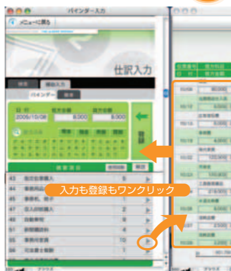
▲仕訳入力画面(クローズアップ) 仕訳された内容は随時バインダーに登録できます。